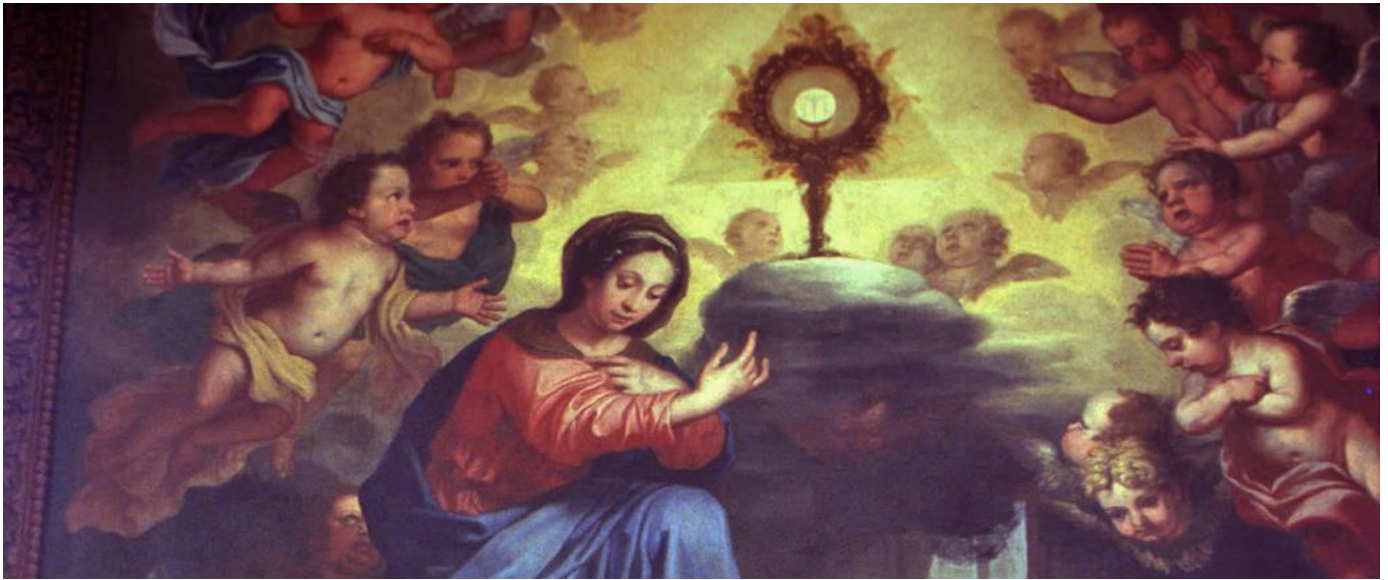
(Eine der Fronleichnamsvisionen der heiligen Juliana von Lüttich: Seit 1209 sah die Augustinernonne den Mond mit einem Fleck. Dieser Fleck, so soll es Christus ihr erklärt haben, sei das im Kirchenkalender noch fehlende Fest zur Verehrung des Altarsakraments.)